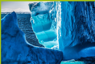
B. Weigand, K.-R. Schulze