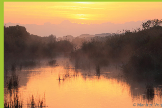
Teilnahme auf eigene Gefahr, Programmänderungen vorbehalten. Rauchen im gesamten Gebäude nicht erlaubt. Für gestohlene Gegenstände wird keine Haftung übernommen.

Weitere Informationen unter: www.naturfoto-team-limes.de